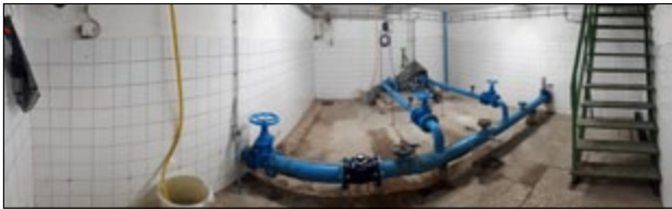
Brunnen vor Umbau