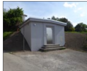
Hochbehälter Tulbing 1

Tür am 23. Juni. Hier besteht die Möglichkeit, die einzelnen Anlagen zu besichtigen.