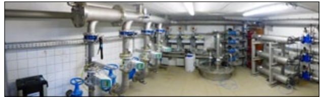
Brunnen nach Umbau mit UV-Anlage

Mit Ende Mai werden die Arbeiten für den Umbau der Wasserversorgung (WVA) Tulbing abgeschlossen sein. Mit einer Investition von etwa € 500.000,- (Endabrechnung noch offen) ist nun die gesamte Anlage am neuesten Stand der Technik. Der Weg, die Wasserversorgung in den Händen der Gemeinde zu belassen, wird fortgesetzt. Nach der Reduktion der Wasserverluste ist der nächste Schritt die Reduktion der Gesamthärte. Um der Bevölkerung der Gemeinde einen Überblick über die WVA zu verschaffen, gibt es einen Tag der offenen