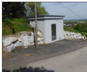
Hochbehälter Wilfersdorf neu