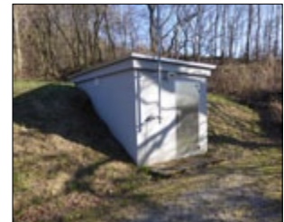
Hochbehälter Tulbing 2