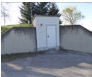
Hochbehälter Wilfersdorf vor Umbau