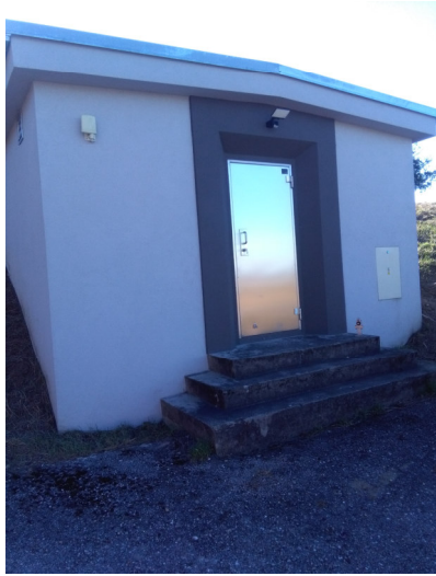
Hochbehälter Tulbing 1