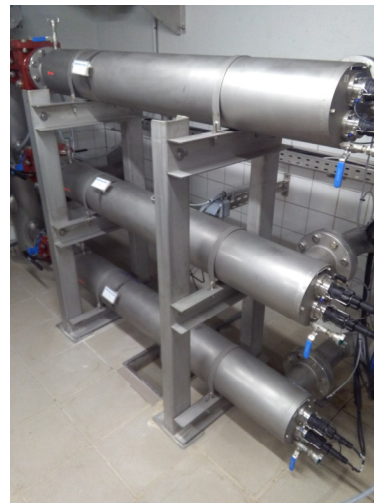
UV-Desinfektion 1, 2 + 3