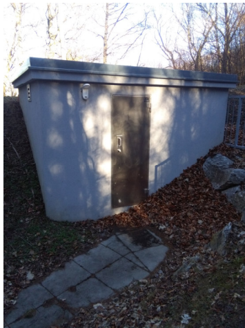
Hochbehälter Tulbinger Kogel 1