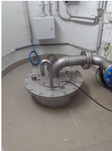
Brunnen Katzelsdorf 1