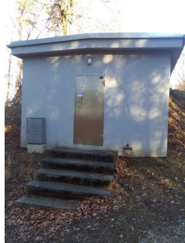
Hochbehälter Tulbinger Kogel 2