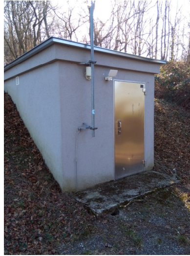
Hochbehälter Tulbing 2