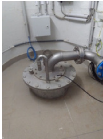
Brunnen Katzelsdorf 1