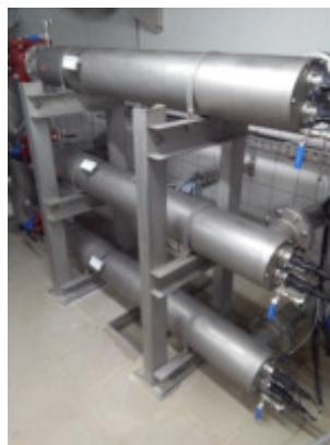
UV-Desinfektion 1, 2 + 3