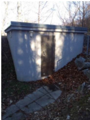
Hochbehälter Tulbinger Kogel 1