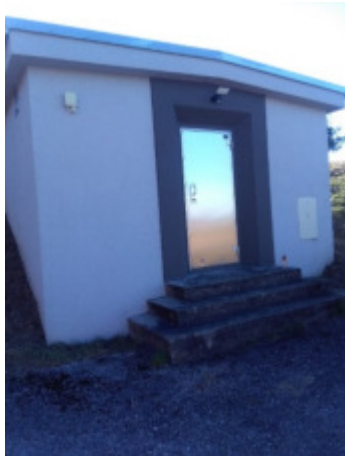
Hochbehälter Tulbing 1