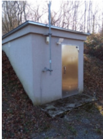
Hochbehälter Tulbing 2