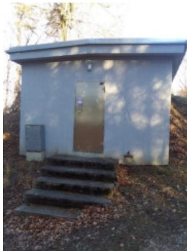
Hochbehälter Tulbinger Kogel 2